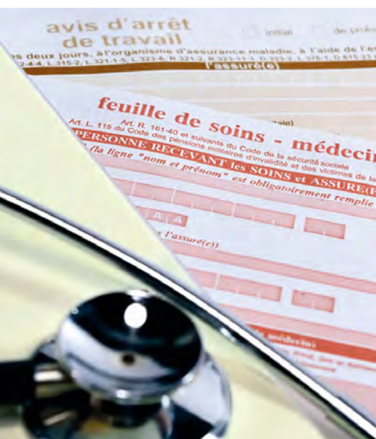
Un.e salarié.e dispose d'un délai maximal de 48h pour justifier son absence.

Trois types d'indemnisation se complètent pour assurer un maintien total ou partiel de la rémunération pendant la durée de suspension :